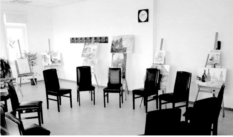
Gündüz Hastanesi Resim Atölyesi