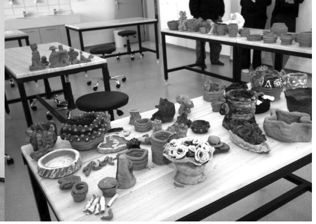
Gündüz Hastanesi Seramik Atölyesi

geleneksel el sanatları, İngilizce, aşçılık ve pastacılık, müzik ve dans kursları aktif durumdadır. Hastaların tedavi ve sosyal rehabilitasyonu yanında birim bilimsel çalışmalar açısından da yoğun bir şekilde çalışan bir araştırma merkezi olarak ta dikkat çekmekte. Birimde hastaların takibinde kullanılan yaklaşık 20 adet ölçek ile hasta değerlendirme formlarının düzenli olarak kaydının yapıldığı bilgisayar tabanlı gündüz hastanesi veri tabanı programı kullanılmakta. 7-8 ay gibi kısa bir sürede bu veri tabanına düzenli takibi olan 120 şizofreni hastasının kayıtları yapılmış durumda.