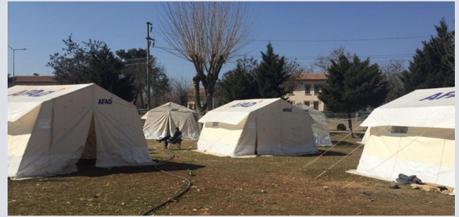
Diyarbakir field assessments