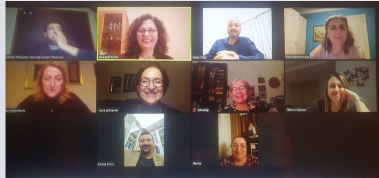
Ankara Branch supervisions