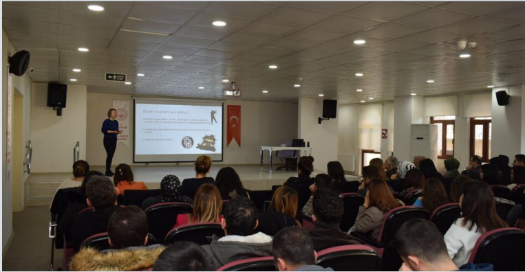
Denizli Ministry of Family and Social Services Provincial Directorate Psychological First Aid Training